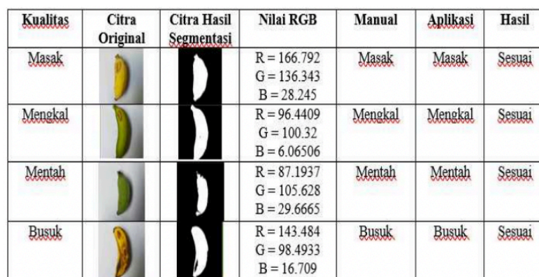
Tabel 3. Warna pisang berdasarkan tingkat kematangannya

Adapun Jusrawati et al. (2021), mengklasifikasikan pisang berdasarkan kematangan dan warnanya pada Tabel 3.